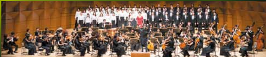
合唱=東京オペラシンガーズ 管弦楽=東京フィルハーモニー交響楽団