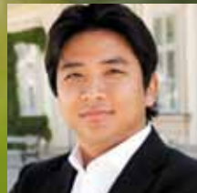
アルト=藤木大地 (カウンターテナー)